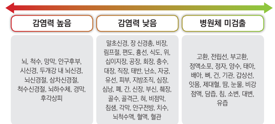
【그림 1】 인체 조직 부위별 감염력 비교

※ 감염력이 없는 검체(타액, 외분비물, 대·소변 등)에 대한 특별관리 불필요