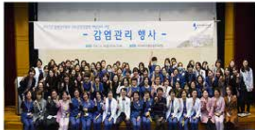
<의료관련감염병 예방관리 행사>