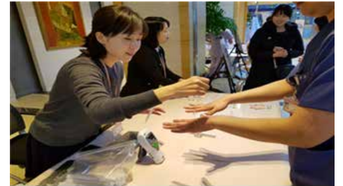
<감염관리행사 체험부스 운영>

2018년에는 3주기 국내인증평가에 대비하여 원내 감염관리 활동을 총체적으로 점검하고, 신종감염병 대응 모의훈련을 진행할 계획입니다. 앞으로도 지역사회의 병원 및 공중보건기관과 적극적으로 협력하여 지역사회 주민을 위한 감염관리 활동에 노력하고자 합니다.