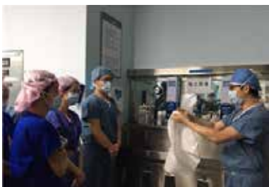
<외과적손위생 인증제 시행>

7월에는 질병관리본부, 경기도청, 수원시 영통구 보건소 등 유관기관 관계자 30여명과 함께 신종감염병(MERS) 즉각대응팀 모의훈련을 성공적으로 실시하였습니다.